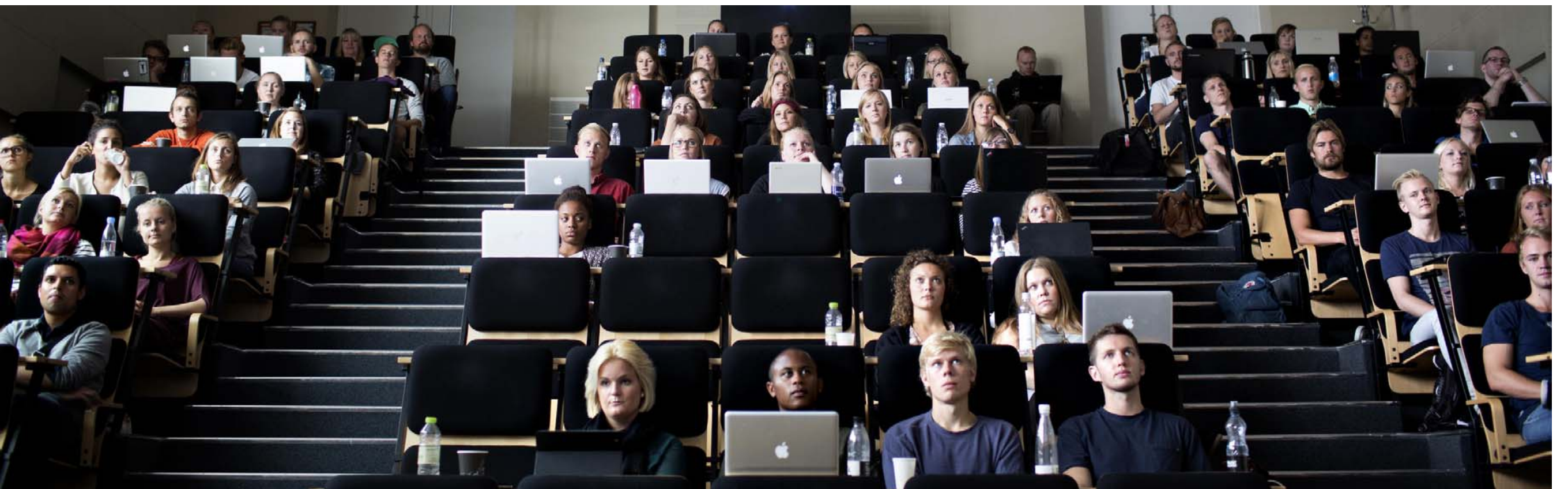
TILVALG. Det har hidtil heddet sig, at studerende med sabbatår i bagagen, har haft lettere ved at opgive deres uddannelser midt i forløbet. Men det er ikke tilfældet, viser resultaterne af den forskning, som dagens skribenter står bag.